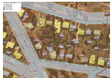
La fonction de translucidité vous permet de mettre en surbrillance des zones d'une carte sur lesquelles vous souhaitez attirer l'attention.

Données géographiques MS SQL : SQL Server 2000 et 2005 avec MapInfo SpatialWare ; prise en charge des données géographiques natives SQL Server 2008 en lecture et des données textuelles SQL Server 2008 en lecture et en écriture